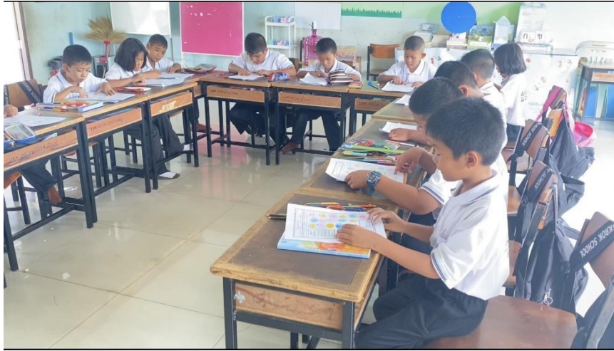
ภาพการอ่านคำควบกล้ำแท้ หลังจากทำกิจกรรมเสร็จเรียบร้อยแล้ว