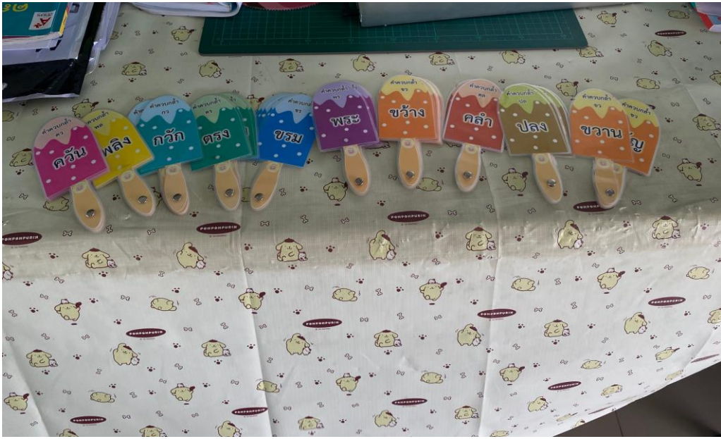
บัตรคำควบกล้ำแท้