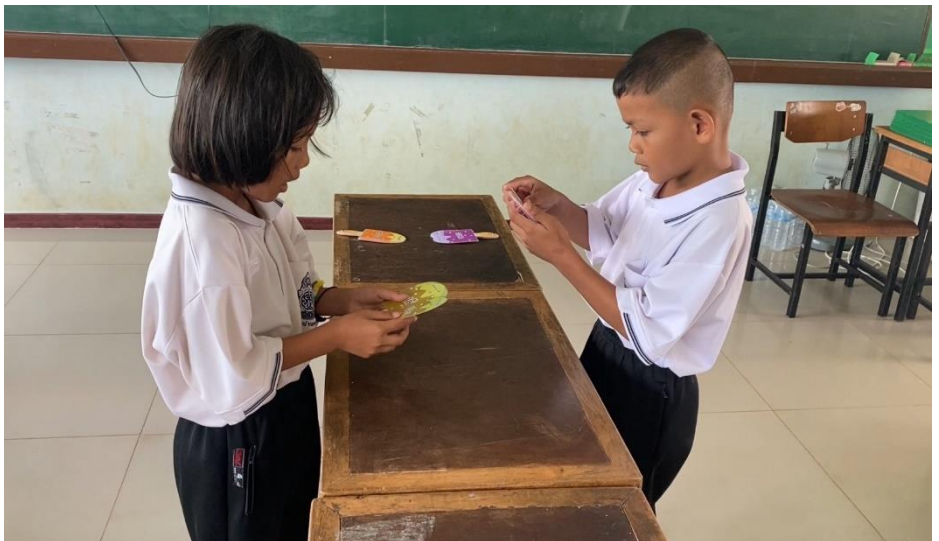
ภาพกิจกรรมเกมการแข่งขันอ่านบัตรคำไอศกรีมคำควบกล้ำแท้